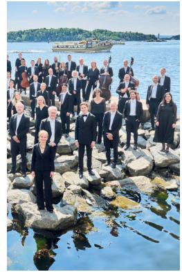
OSLO-FILHARMONIEN Oslo-filharmonien, Norge