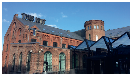
KUNSTHØGSKOLEN I OSLO