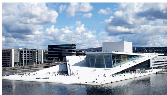
DEN NORSKE OPERA & BALLETT