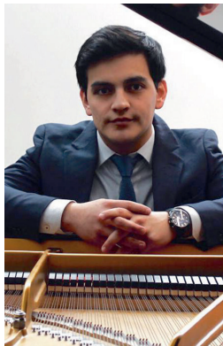
CÉSAR CAÑÓN Pianist, Colombia