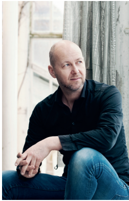
SVEINUNG BJELLAND Pianist, Norge