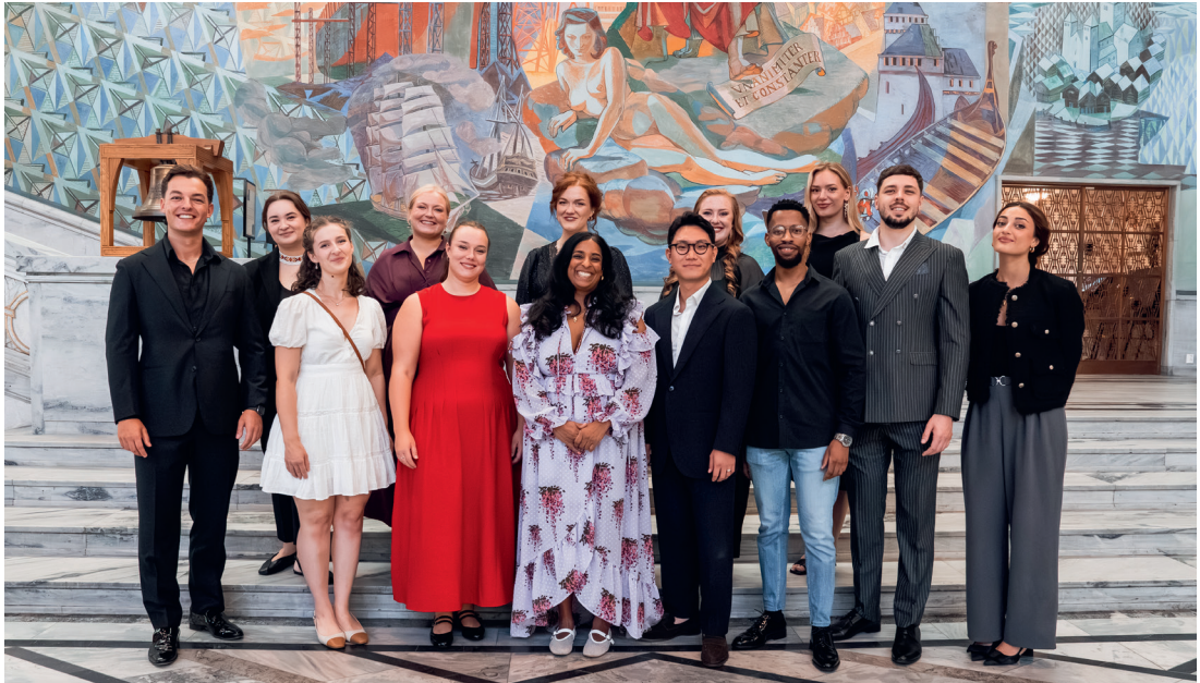
Årets semifinalister med kulturminister Lubna Jaffery.