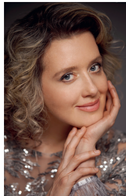
OLESYA TUTOVA Pianist, Norge/Russland